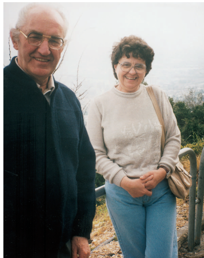
Zarándokúton. „Mindketten a Szűzanyáért dolgoztunk és éltünk.”

Főzni kezdtünk. Jöttek is sokan, naponta 25-30-an de nemcsak gyerekek, ebédre bárki betérhetett. Egytál ételt főztünk.