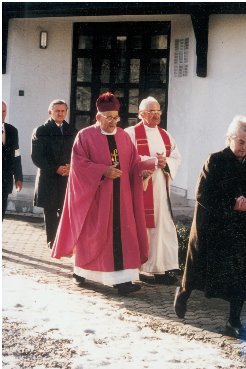
Készület a körmenetre

Még templomunknak csak a falai álltak , akkor is itt tartottuk meg búcsúnkat. Igen sokan jöttek, buszokkal is. Akik jelentkeztek előre, szállással fogadtuk. Híveinket kérdeztük, hány embert fogadnának be. Címekkel a kézben vártuk őket. Érkezés után vacsorával fogadták a szállást adók, az ünnep előtti este. De sokan aludtak a falak között, és a fedetlen kóruson, éjfélig tartó szentségimádás után. Ebédet főztünk nekik az udvarban. Lángost és fánkot hoztak a hívek.