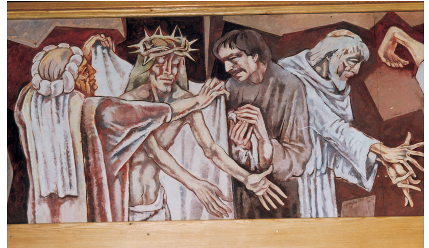
Középen a sötétruhás férfi maga a festő

Atya a Szűzanya rajongója, „bolondja” volt. Ezért fogadhatott el munkatártnak. A gyerekek nagyon szerették, mert bolondozott, mókázott velük, átfütyült nekik a túloldalra, hogy megnyerje őket a Szűzanyának. Más vallásúak belógtak az órára titkon. Volt 120 hittanosa, és 60-70 első-áldozója is. Mikor velük beszélt, ragyogott az arca. Bárki bármikor jöhetett hozzá, mindenkit meghallgatott, ha kellett, pénzzel is segített. Béke papságba nem lépett be, bár