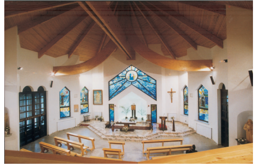
Kész a templom

Kihirdettem: az Egyházközségnek felajánlott pénz ne a kápolnára, és ne a plébánia megszervezésére menjen, hanem a nyomor enyhítésére! Az az első! Elképesztő nyomor volt a háború után! Az embereknek először szeretet kellett, nem a templom.