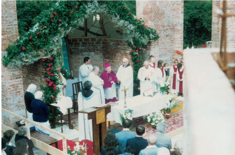
Épül a templom