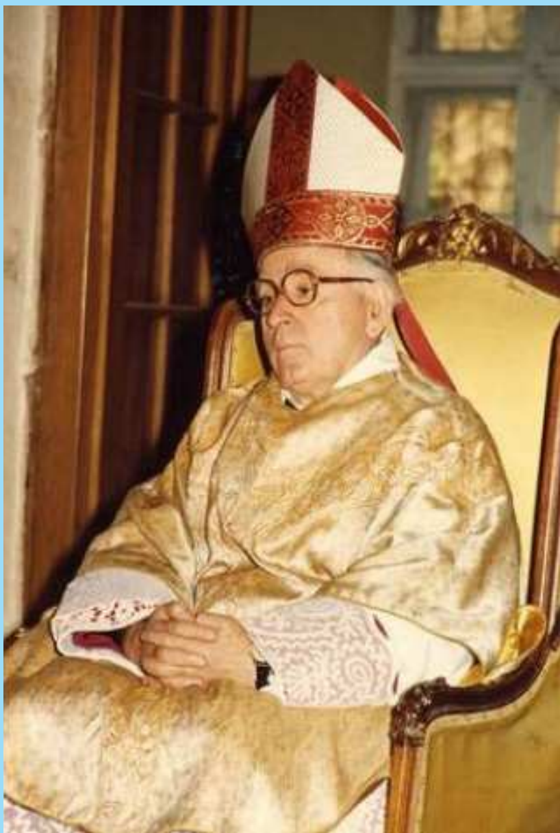
Az áldott Szakos Gyula püspök Atya. A nagycsaládosokat segítette és minket: a templom építését!