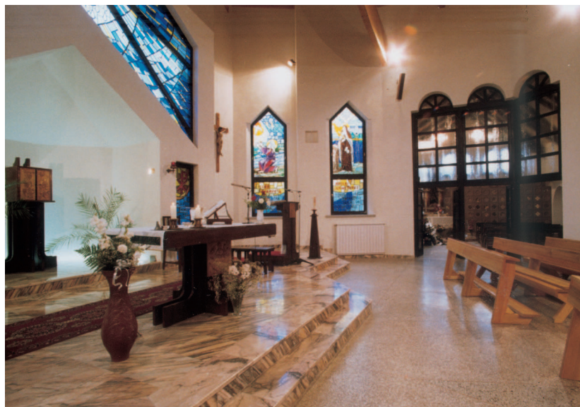
Templomunk ragyogó belseje