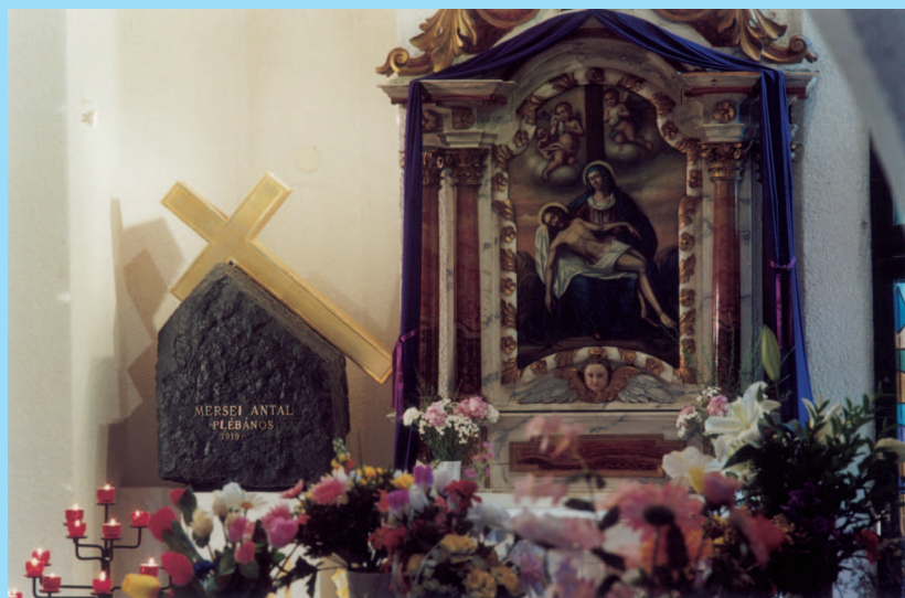
Antal Atya síremléke a kolumbáriumban