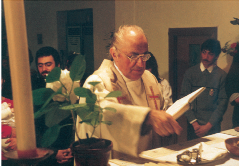
Keresztelés a régi kápolnában